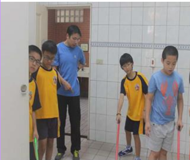
打掃時間老師實地到場指導清潔