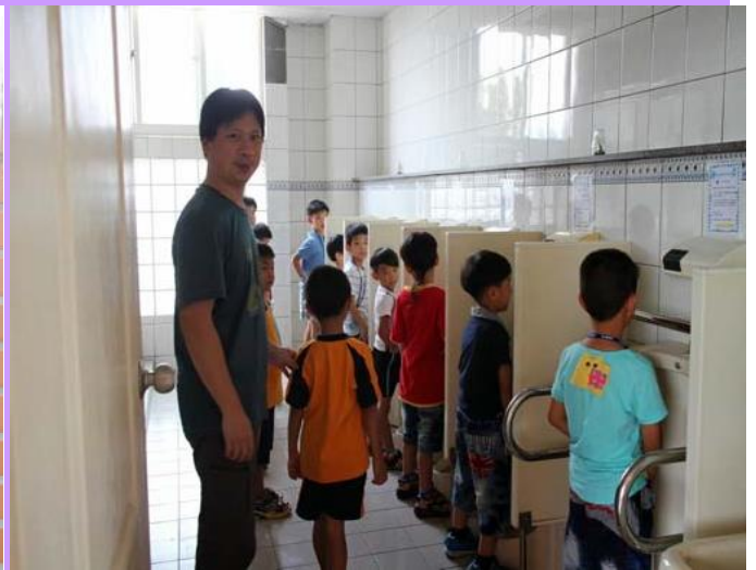
練習正確如廁方式