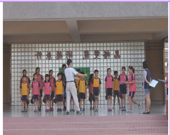
每週四的朝會頒獎給優質廁所獲獎的班級