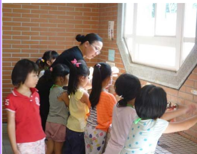
如廁禮儀—要洗手並不把水潑地