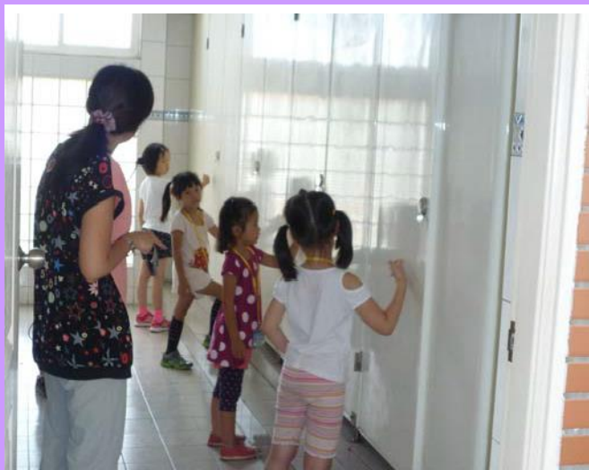
廁所禮儀—應先輕輕敲門看是否有人