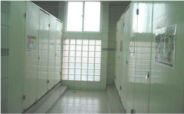
寬敞明亮又潔淨的六星級廁所