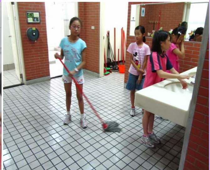
打掃的學生以維護廁所環境潔淨為目標